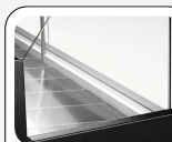
Zone de présentation en acier inoxydable