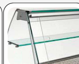
Portes coulissantes arrière