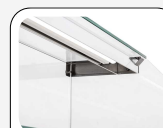
Lampe LED interne